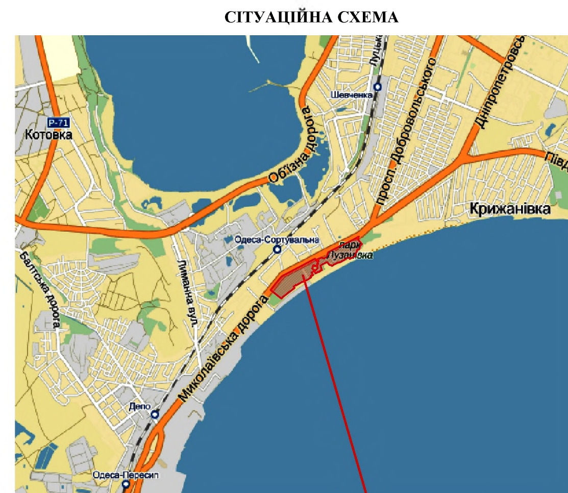
територія парку-пам'ятки садово-паркового мистецтва місцевого значення парк ім. Котовського (гідропарк «Лузанівка»)