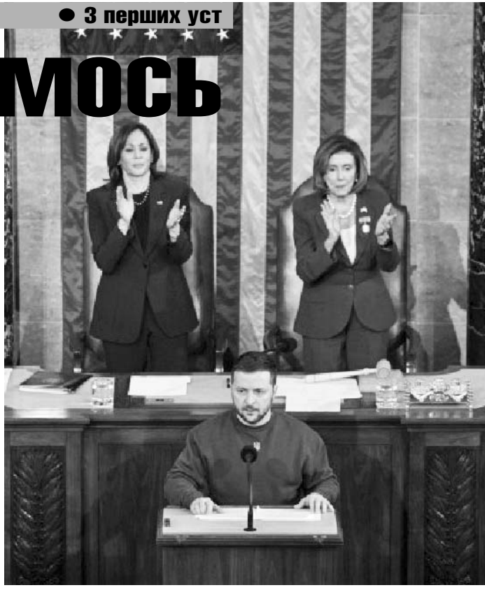
• 3 перших уст

Якщо ваші «Патріоти» зупинять російський терор проти наших міст, це дасть змогу українським патріотам повною мірою працювати на захист нашої свободи. Якщо росія не дістає до наших міст артилерію, вона намагаться знищити їх ракетами. Ба більше, росія йшла спільна в цій генцидній політиці. Це Іран. Іранські вбивчі дрони, які йдуть до росії сотнями, стали загрозой для нашої критичної інфраструктури. Так один терорист знаходив іншого. І це питання часу, коли вони вдарять по інших ваших союзниках, якщо ми не зупинимо їх зараз. Ми повинні зробити це! Я вважаю, що не має бути