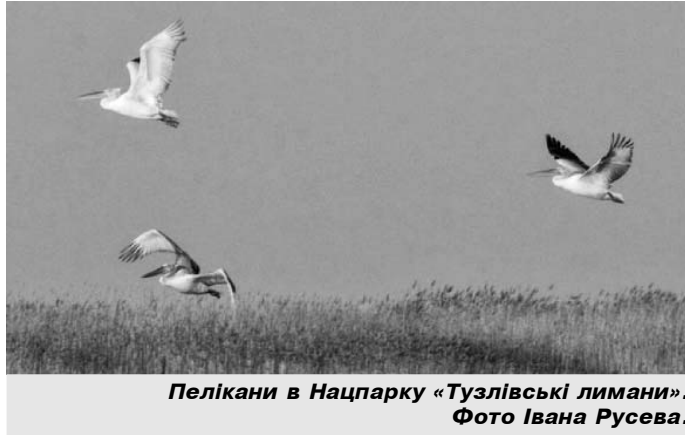
Пелікани в Нацпарку «Тузлівські лимани».