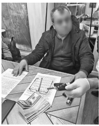
Управління комунікації Національної поліції України.

Проект реалізується спільно з Незалежною антикорупційною комісією (НАКО) за підтримки офісу спеціального радника Великої Британії з питань оборони.