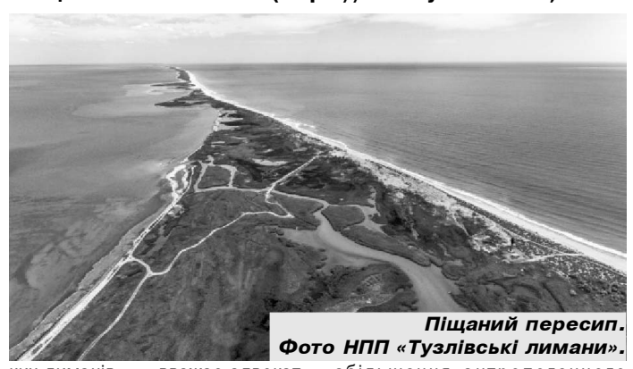
Пляжний пересип.

Наслідком таких дій місцевої влади може бути збільшення антропогенного навантаження на особливо цінні землі «Тузлівські