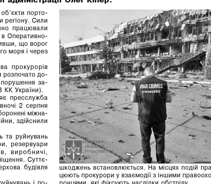
Шкодижені встановлюються. На місцях подій працюють прокурори у взаємодії з іншими правоохоронцями, які фіксують наслідки обстрілу.

Огляд триває, повний перелік руйнувань і по-