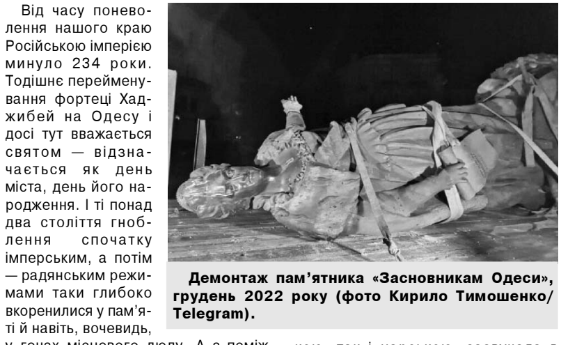
Демонтаж пам'ятника «Засновникам Одеси», грудень 2022 року.

На десятому році війни росії проти України, попри сотні тисяч смертей мирних співвітчизників, зокрема й наших земляків (про реальні втрати наших захисників — а вони не мали — дізнаємося уже після Перемоги), попри повінені оселі, храми, пам'ятки архітектури і в Одесі, і в багатьох містах та селах нашої області, попри спалені елеватори, разом зі збіжжям, розтрощені порти й моровоззалі, майже половина з-поміж нас, жителів Одещини, все ще тяжіє до царсько-советсько-російського спаду. І не хоче його спекатися.