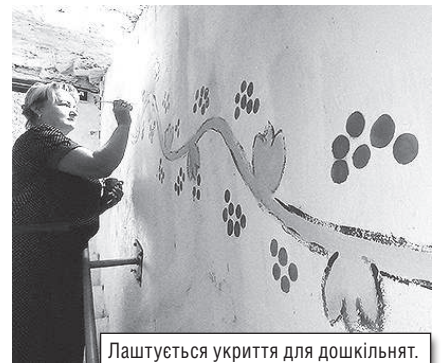
Лаштується укриття для дошкільнят.

У Любашівському дитсадку «Сонечко», який не працював з початку війни, ташувався Пункт незламності. Коли ж нарешті вирішилось питання про відновлення роботи дитсадка, колектив власними силами виконав ремонт у групах, спальнях та ігрових кімнатах. Найголовніше — облаштували тимчасове укриття. Під нього відвели підвал, що раніше слугував для зберігання овочів та фруктів. Приміщення спершу вичистили і впродовж літа просушили. Потім відремонтували і полагодили підлогу. Вихователі власноруч розписали вхід та стіни візерунками.