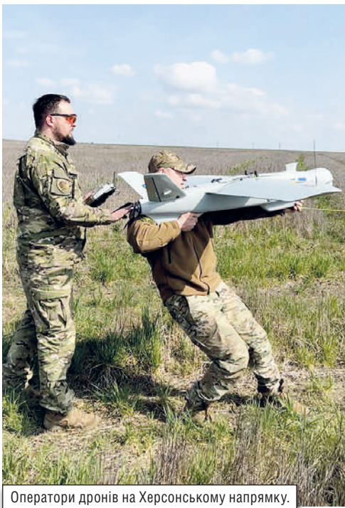
Оператори дронів на Херсонському напрямку.