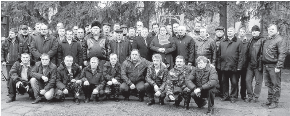
Щороку, 15 лютого, «афганці» збираються біля пам'яток, щоб вшанувати пам'ять загиблих побратимів, українців, які загинули у безглузді війні. Вони були простими солдатами в Афганістані. Воювали, як і всі. Зараз багато наших «афганців» знайшли в собі сили, і, не зважаючи на вік, знову стали в бойовій стрій.

Вже 25 лютого 2022 року він разом з групою односельчан прямував у пункт дислокації 35-ї окремої бригади морської піхоти імені контр-адмірала Михайла Остроградського. У військовій частині ветерана направили у дивізіон самохідної артилерії в якості радиста.