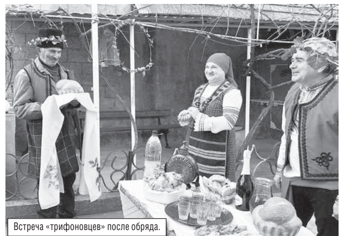
Встреча «трифоновцев» после обряда.

А пока у виноградарей — профессионалов и любителей — есть возможность пообщаться, поделиться опытом и обсудить предстоящий год.