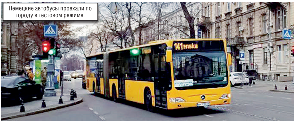
Немецкие автобусы проехали по городу в тестовом режиме.