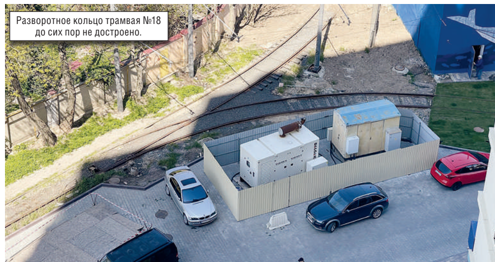
Разворотное кольцо трамвая №18 до сих пор не достроено.

Запускать разворот путевым треугольником снова руководство ОГЭТ опасается. Это рискованно, потому что у водителя остается много «слепых» зон. В департаменте говорят, что изучают возможные варианты решения проблемы. А пока в качестве альтернативы трамваю предлагают маршрутку 18К, курсирующую с 11-й до 16-й станции Большого