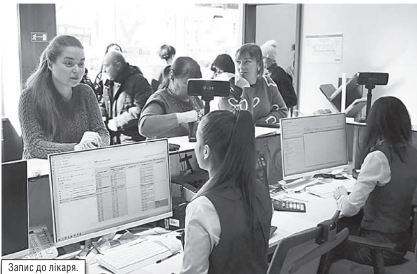
Запис до лікаря.