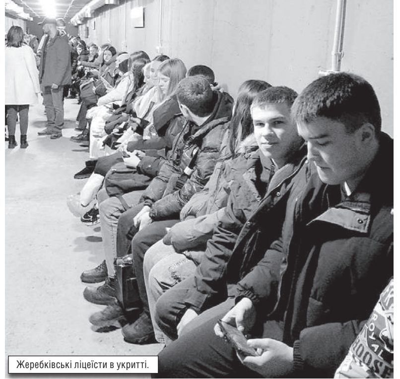
Жеребківські ліцеїсти в укрітті.