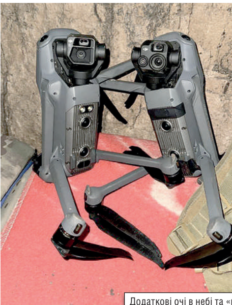
Додаткові очі в небі та «маленькі бомбардувальники».

— Я знав, що буде повномасштабне вторгнення росії, але розраховував десь на літо. Коли перед початком війни працював оперуповноваженим, у нас були навчальні тривоги. В ніч на 24 лютого я погано спав і почув, як о четвертій ранку в робочому чаті оголосили тривогу. Дуже розлютився, бо думав, що керівництво знову вирішило погратися в солдатиків. Дорогою на роботу увімкнув у машині улюблену радіохвилю, почув, що міста України обстріляні балістичними ракетами. У мене був шок... Тоді я переживав за брата: він також пішов служити в поліцію, і війна застала його в Житомирі, у навчальному центрі. Згодом неодноразово писав рапорти, щоб мене перевели в колишній батальйон, але через службу діяльність це не погодили.