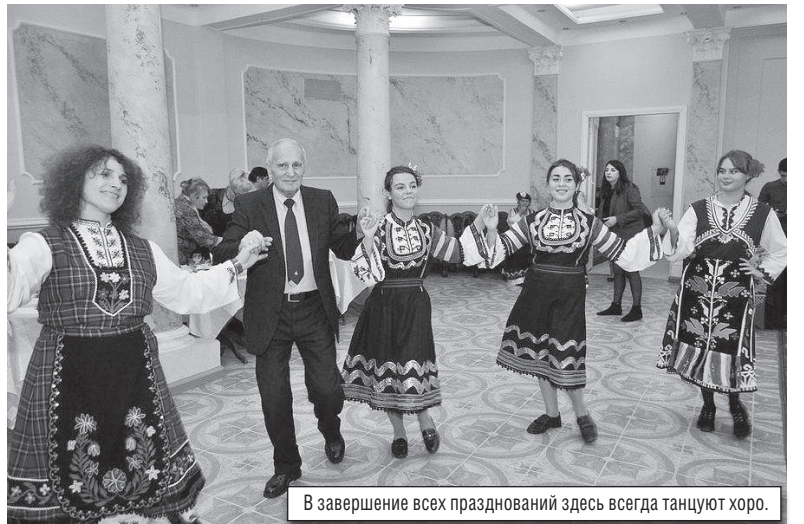
В завершение всех празднований здесь всегда танцуют хоро.