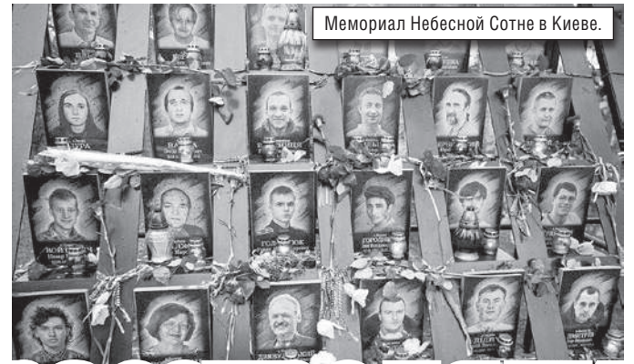
Мемориал Небесной Сотне в Киеве.

В эти трагические дни за них отдали свои жизни более 100 человек. Тех, кто погиб за достоинство и свободу, назвали Героями Небесной Сотни. К годовщине событий 2014 года «Одесская жизнь» вспоминала, что тогда происходило в центре Киева, как в дальнейшем расследовали преступления власти и правоохранителей и как увековечили память о погибших на Майдане.