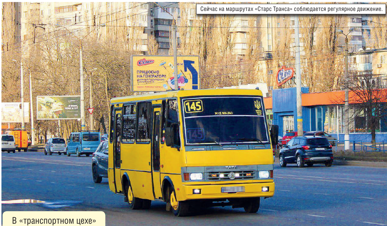
Сейчас на маршрутах «Старс Транса» соблюдается регулярное движение.

В «транспортном цехе» горсовета в конце 2023 года произошли серьезные кадровые изменения, за которыми последовали очередные «транспортные стратегии» и обещания развивать муниципальные перевозки. Однако горожане, на чьих глазах исчезали трамвайные маршруты, а улицы поделили между собой частные перевозчики, были бы рады не потерять хотя бы то, что осталось. «Одесская жизнь» узнавала, стоят ли реальные управленческие решения за оптимизмом чиновников и на какой муниципальный транспорт могут рассчитывать пассажиры в ближайшее время.