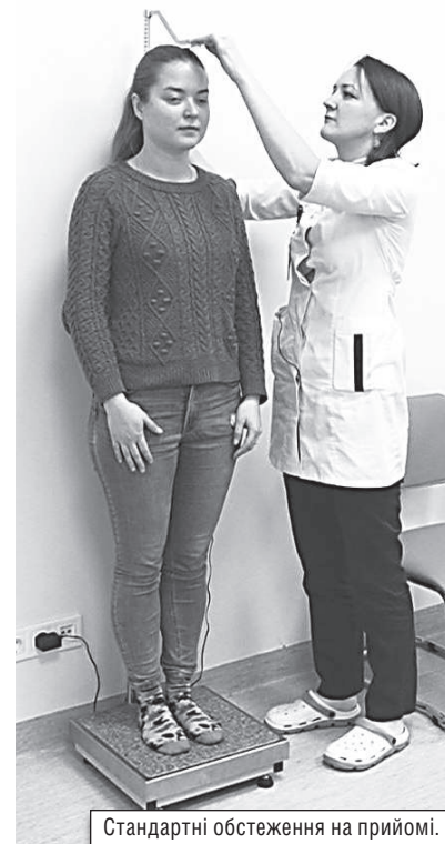
Стандартні обстеження на прийомі.