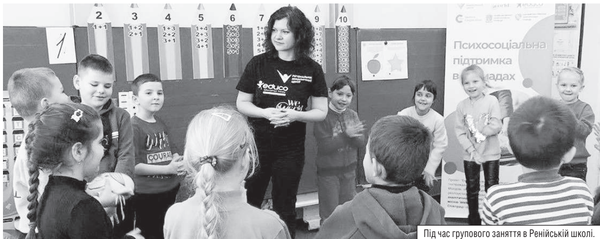
Під час групового заняття в Ренійській школі.

У громадах Ізмаїльського району, зокрема Ренійській, вже понад рік працює проект «Екстрена освіта та психосоціальна підтримка постраждалого від конфлікту населення в Україні та Молдові, особливо дівчат, хлопців, підлітків та жінок», який реалізовується громадською організацією «Регіональний аналітичний центр» у співпраці з Ренійською міськрадою – за фінансової підтримки з Іспанії.