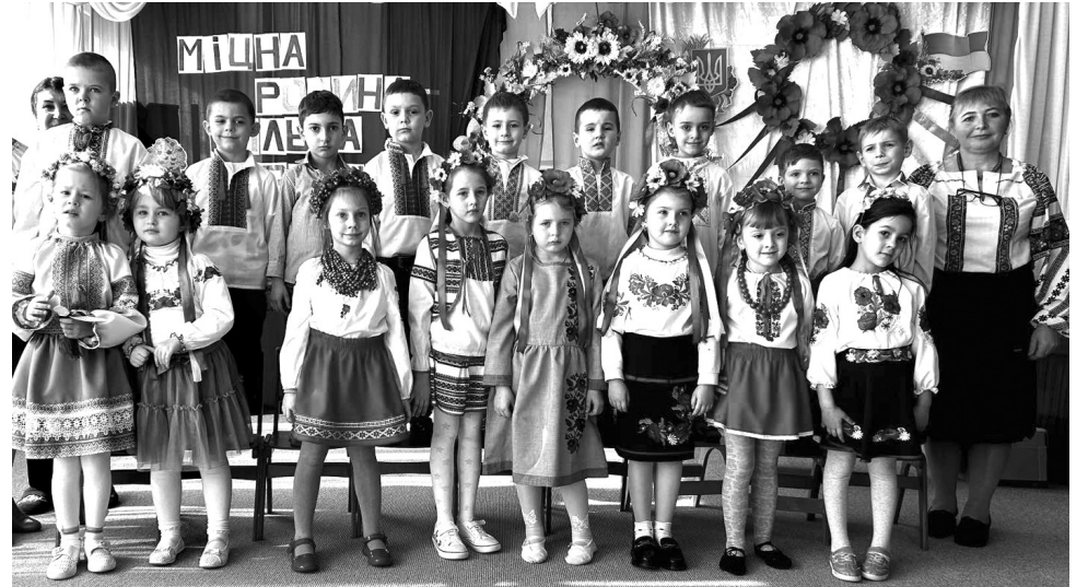
На святі у дитячому садочку «Колосок» (м. Татарбунари)

ЛИМАНСЬКА СІЛЬСЬКА РАДА оголошує конкурс з відбору суб'єктів оціночної діяль- ності, які будуть залучені до проведення неза- лежної оцінки земельних ділянок комунальної власності в 2024 році на території Лиманської сільської ради, внесених до переліку земель- них ділянок несільськогосподарського призна- чення, які підлягають продажу в 2024 році від- повідно рішення Лиманської сільської ради № 908-VIII від 03 липня 2024 року з кадастровим номером 5125082700:02:002:0025 загальною площею 0,3603 га для будівництва та обслуго- вування об'єктів рекреаційного призначення.